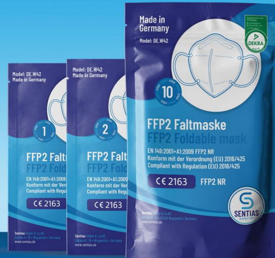
CE-zertifizierte FFP2 Masken made in Germany mit DEKRA-Siegel