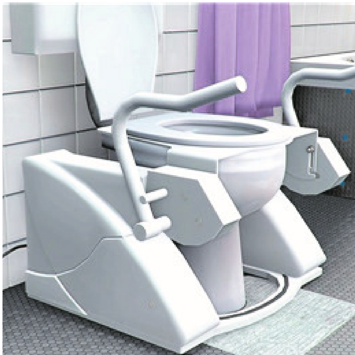
Diese Liftoilette kann mehr als nur NEHMEN, sie kann auch GEBEN – Unterstützung beim Hinsetzen und beim Aufstehen.