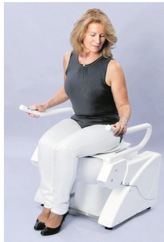
Bei GL Projects kann man die WC-Aufstehhilfe R2D2 (Bild) oder BC65 in Zukunft auch mieten. Ein regelmäßiger Service wird im Mietpreis inkludiert sein.